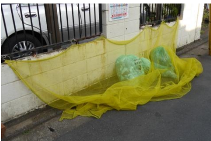
市内のゴミの集積所