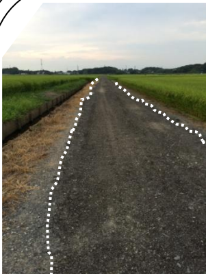
農道に敷かれた砂利 (白い点線で示した枠内の黒っぽい部分)

農政課と道路課に砂利敷きを依頼すると「入れた砂利が飛んでしまい、苦情が来ることもある。道に面している田畑の所有者の承諾が必要」との説明でした。要望を寄せてくださった方がそれぞれの田畑所有者に承諾を得てください、改めて道路課へ申請を行いました。同時期に別の方からも要望が市に寄せられているとのことで、早急に対応を依頼しました。現在は写真のように砂利が敷かれ、平らな道になっています。