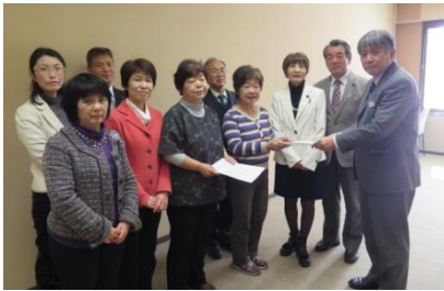
県当局（右）に要望書を手渡す

「移転問題を考える蓮田の会」として、蓮田市長と懇談を行い、市から県へ要望してほしいことを伝えました。参加者は「県へ、障がい児の救急受け入れを要望してほしい」「外来が週2回では不安」など切実な思いを訴えました。