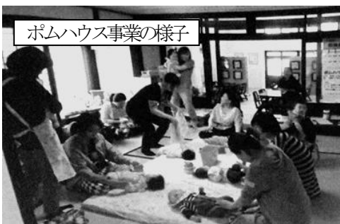
ポムハウス事業の様子

安心して子育てできる環境を整えるために、きめ細かいニーズの把握や、行政と医療との連携充実が必要不可欠です。