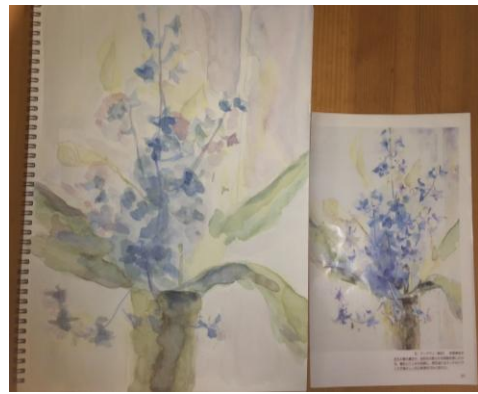
「花」 左が船橋模写作、右がお手本です。