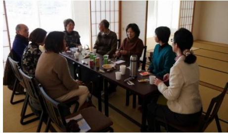
最初に「蓮の葉ロビー」で職員より説明を受ける(上)。「どきどきホール」を見学(中)。見学の後、和室で交流(下)

「きめ細やかな配慮がされた、ちょうどいい規模」「企画を見ると蓮田は文化人が多い」「何が企画されているか、もつとわかりやすく伝えてほしい」「冷水器がほしい」「イベント時にバスの時間を増やしてほしい」など、ご意見をいただきましたので、担当課に伝えました。 たくさんの方に利用してもらえよう、バスの改善を求め、3月議会で一般質問します(詳細は次号以降)。