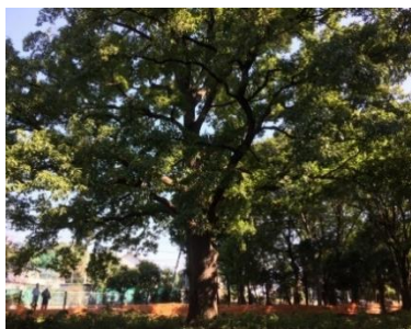
高さ約25m、幹回り3m強あった大クヌギ。樹齢77年

しかし、要望や陳情は議会で審議がなく、各議員への配布のみで、採決は行われませんでした。(請願は紹介議