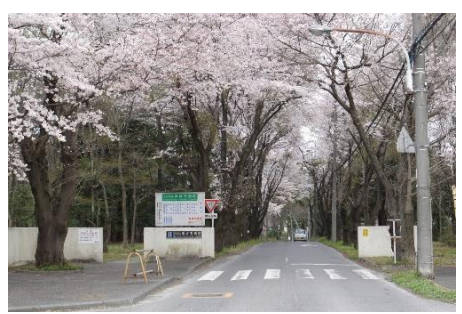
東埼玉病院入口の8年前の写真。たくさんの桜の木があった。

Q② 東埼玉病院内を通る計画道路は、路線バスだけでなく、大型トラック等も通すのですか？