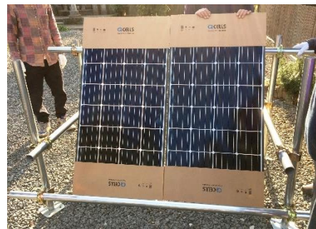
私が参加したあるワークショップ。太陽光パネルを自分で組み立て蓄電池につなぐ。省エネ意識が向上する。

「白岡市ではLED照明の購入や蓄電池、太陽熱利用設備にも補助がある」と紹介しましたが、「太陽光発電補助以