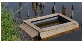
市民団体製作の捕獲装置 こちらはカメに大好評(?)