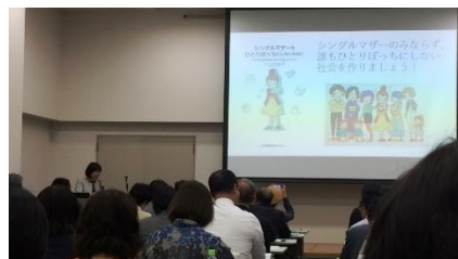
②女性と子どもの貧困講義の様子 女性の4人に1人は夫から暴力を受けている調査結果が明らかに。

講師の「3万円あればもうけ過ぎ。もっと国保税を引き下げられる」との言葉に大きくうなずきました。