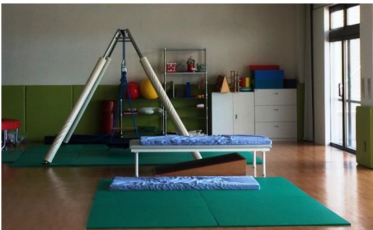
↑カリヨン:リハビリ室(月曜・木曜開室)