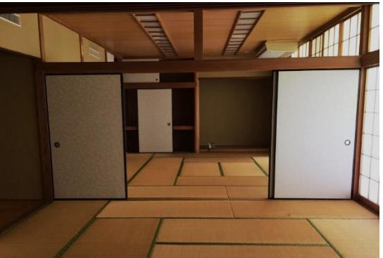
↑旧特別支援学校:家庭生活訓練室 ↓天窓のある明るいプール(雨漏り跡あり)