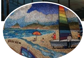
←プールサイドの精緻で色彩豊かなタイル画拡大図