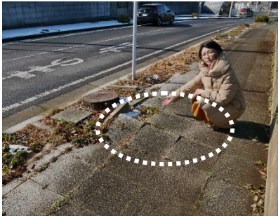
街路樹(伐採済)の根が盛り上がり、歩道ブロックがめくれている危険。(船橋が指さす白点線円内)

また、「市役所入口からの歩道がガタガタ」(写真参照)の声があり、担当課では「今年度中に抜根し植樹マスを整地。2019年度予算に歩道整備費を要求中」としています。ぜひお気軽にご要望をお寄せください。