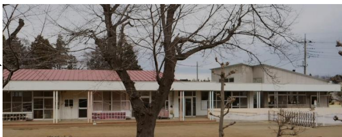
黒浜保育園・子育て支援センター外観

が必要。保育園の整備計画を具体的に進めるべき」と求め、部長は「大変重要な課題。保育園や小規模保育事業所などの整備を積極的に検討したい」と答弁しました。 「保育士の処遇改善」も重ねて求め、「関係課と協議したい」と答弁がありました。