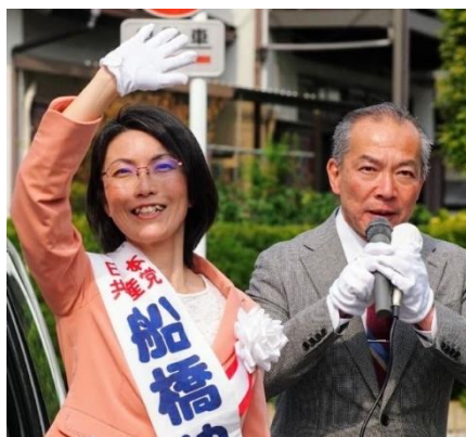
市議選中、演説する伊藤岳参院予定候補（右） 蓮田市内

7月の参院選挙で、埼玉選挙区は定数が3↓4に1議席増です。蓮田市議選でも応援に駆けつけた、日本共産党の伊藤岳参院選予定候補は、前回の参院選では4位で惜敗しました。今度