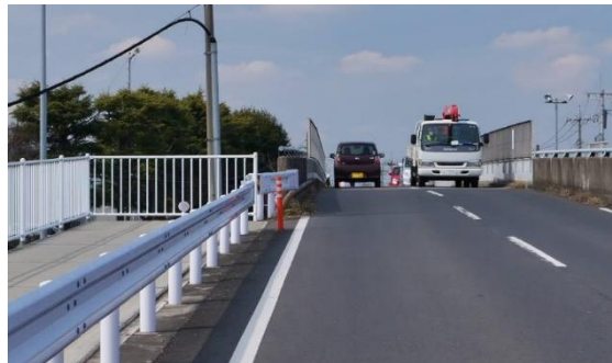
桜ヶ丘橋 黒浜公園側から撮影。左側の広い歩道は橋の手前まで。橋の上は車道しかなく、歩行中の車のすれ違ひは危険な状態。