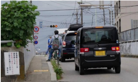
宿浦橋 宿の交差点側から撮影。歩道が狭く、雨天時に傘をさして両側からすれ違ふのは困難。小学生が車道に降りる場面もある。

その後も議会で現在の危険性と、設置の唯一の機会を逃さないよう質問を重ねました。自治会からも市に要望が行われ、自治会と市職員での