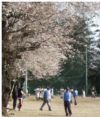
黒中校庭での野球の練習風景 (記事の内容とは無関係です)