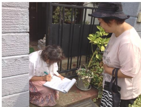
玄関先で気軽に署名に応じてくれる市民

東部北 地域の小 児救急医 療を守る ため、今 後も引き 続き運動 を広げて 行きまし よう。