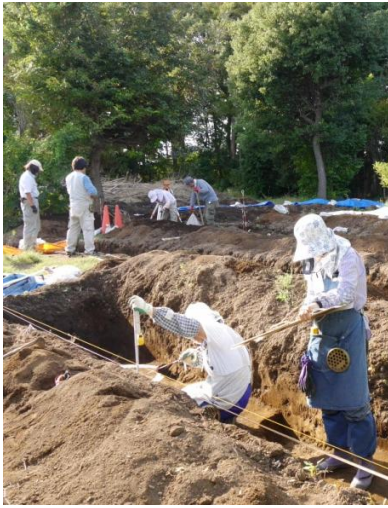
発掘調査の現場風景 (10月8日撮影)

この遺構をどのように整備するのかが「黒浜貝塚整備構想・基本計画策定委員会」で審議が行われています。貴重な遺構の整備については全国的にも注目を集めているようです。当時がしのばれるような整備がされるといいですね。